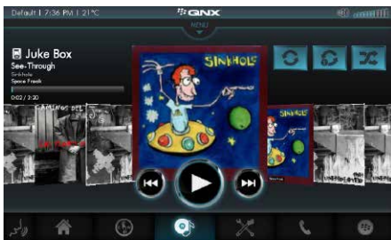
多媒体 支持全功能的媒体播放（包括 iPod、iPhone，DLNA服务器，USB大容量存储设备和流式互联网收音机）