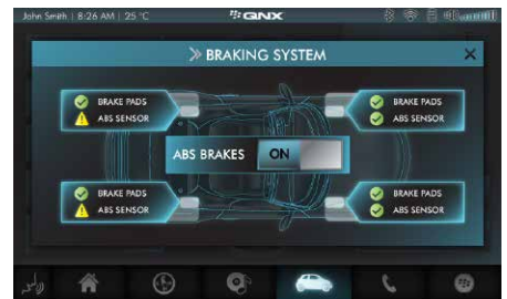
本机接口 用于安全控制访问底层硬件与系统服务的明确 API