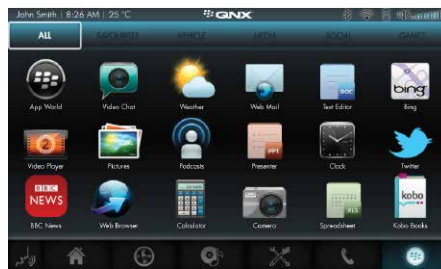
应用程序商店 支持下载应用程序和应用程序商店功能