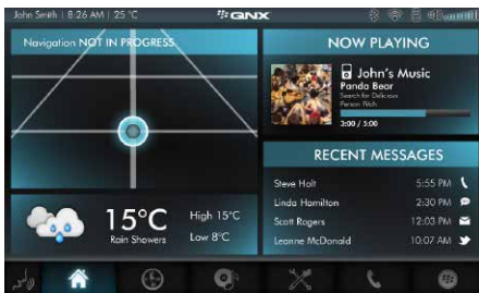
主屏幕 使用基于HTML5的应用程序部件创建可定制的主屏幕