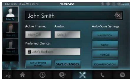
个性化 支持包括可下载应用程序的用户界面外观更换