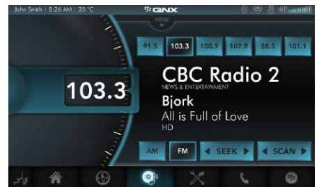
收音机 在指定平台上与车载DSP集成的RDS收音机接口